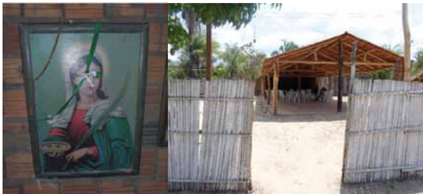
Imagem da Padroeira, Santa Luzia, tirada de um quadro da sala de uma moradora e imagem do pavilhão onde ocorrem reuniões e festas.

Através da música, com as cantorias, o Tambor de Crioula difunde narrativas que discutem o cotidiano, e experiências de opressão e de resistências, desde os tempos do cativo. A organização mais comum acontece com a participação das mulheres na dança e na