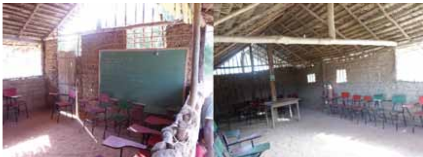
Escola localizada na localidade de Matão.

As moradias dos povoados do quilombo geralmente são habitadas pela mulher, seu esposo e seus filhos. Porém, há casos de mulheres que moram apenas com os filhos, e também casos de mulheres que