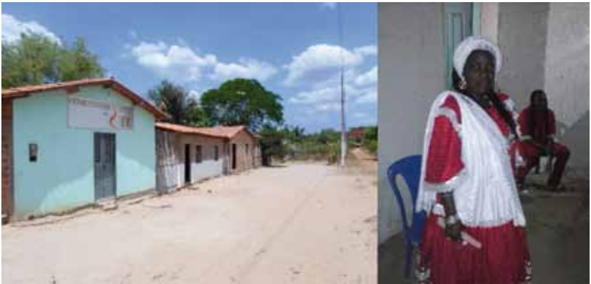
Imagem da igreja evangélica, Comunidade de Fé, na localidade de Matão, e, ao lado, imagem de integrante da comunidade quilombora em celebração de religião afro-brasileira.

cantoria, e os homens tocando os tambores. São utilizados três tambores feitos de madeira e couro, de tamanhos distintos, produzindo sons com tonalidades diferentes.