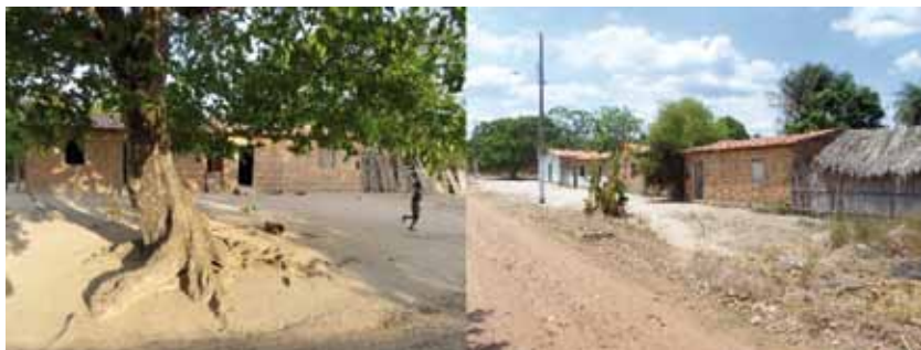
Imagens das localidades Matinha e Matão.