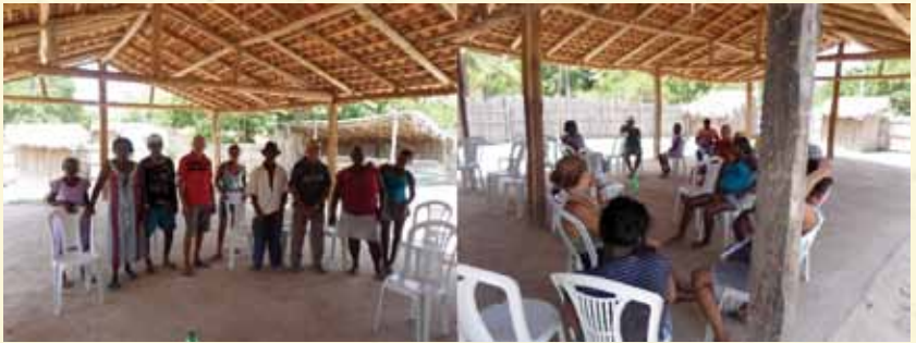
Moradores de Matões dos Moreira em Reunião para discutir sobre a produção desta narrativa .

Muitas das crianças e adolescentes da comunidade que conseguem continuar estudando precisam ir morar na cidade de Codó. Algumas famílias conseguem meios para que seus filhos continuem estudados, promovendo a permanência destes na cidade, no entanto, outras crianças encerram, nos primeiros anos, a sua vida escolar. Muitos quilombolas em Matões dos Moreira têm reclamado melhores condições para educação de seus filhos que, quando ficam na comunidade deixam de estudar, e quando saem, ficam muitas vezes distantes dos pais, tornando-se mais vulneráveis sem esse convívio, se distanciando da comunidade, o que promove uma forma particular de êxodo. Em Matões dos Moreira, há uma grande carência de escolas mais bem estruturadas, com ensino fundamental e médio, que promovam a permanência do estudante na localidade e o direito de todos estudarem. Há também a necessidade de um currículo voltado para as particularidades locais, as questões étnico-raciais e o estímulo à formação de professores da localidade.