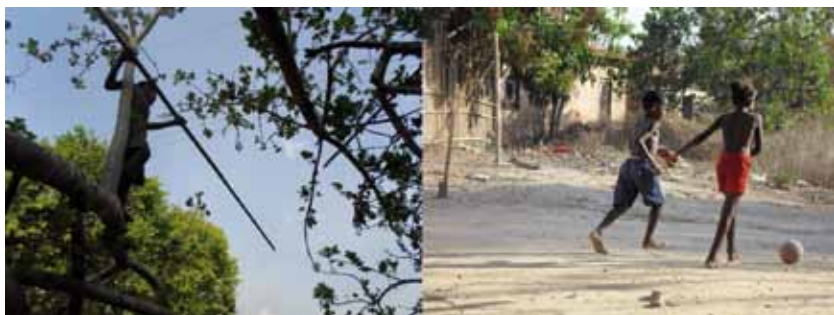
Foto de criança da comunidade colhendo seriguelas e outras jogando futebol.

Narrativas de alguns quilombolas mencionam um fato marcante a respeito da ocupação do território. Dizem que nos primeiros tempos , havia um grupo de quilombolas, fugidos do cativeiro, que estava reunido próximo a alguns pés de mangueira, preparando uma carne de