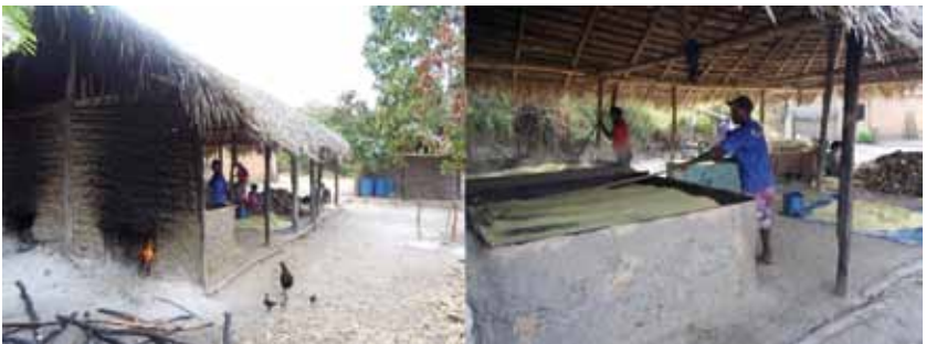
Imagens da casa de forno em Matão.

Essa narrativa, destacada na memória de quilombolas de Matões dos Moreira, sugere que o grupo reunido nos primeiros tempos estava bastante afastado, sem muito contato com outras pessoas, pois não acompanhava acontecimentos dos lugares do entorno. Ao serem informados do dia santo , jogaram a carne fora, em consideração com a conduta cristã. Essa história é contada a fim de marcar uma singularidade vivida por seus ancestrais: o afastamento, seja geográfico, seja cultural, em relação aos demais habitantes da região. Os quilombolas comentam que o lugar onde se reuniram os primeiros negros refugiados que deram origem ao quilombo não foi escolhido por acaso, mas porque garantia certo isolamento, em função do difícil acesso e da mata densa. Ainda hoje nos períodos chuvosos, o quilombo é acessado com dificuldade, pois é cortado em parte pelo rio Codozinho, havendo muitas áreas alagáveis que demandam travessias em canoas ou por uma ponte. Mesmo os automóveis de melhor desempenho em terrenos acidentados têm dificuldade para circular na região, sobretudo no inverno, que no Maranhão corresponde à estação das chuvas.