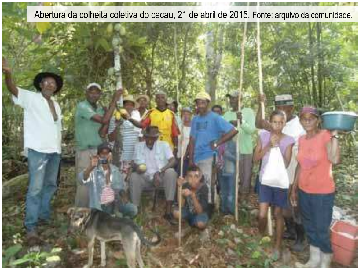
Abertura da colheita coletiva do cacau, 21 de abril de 2015.